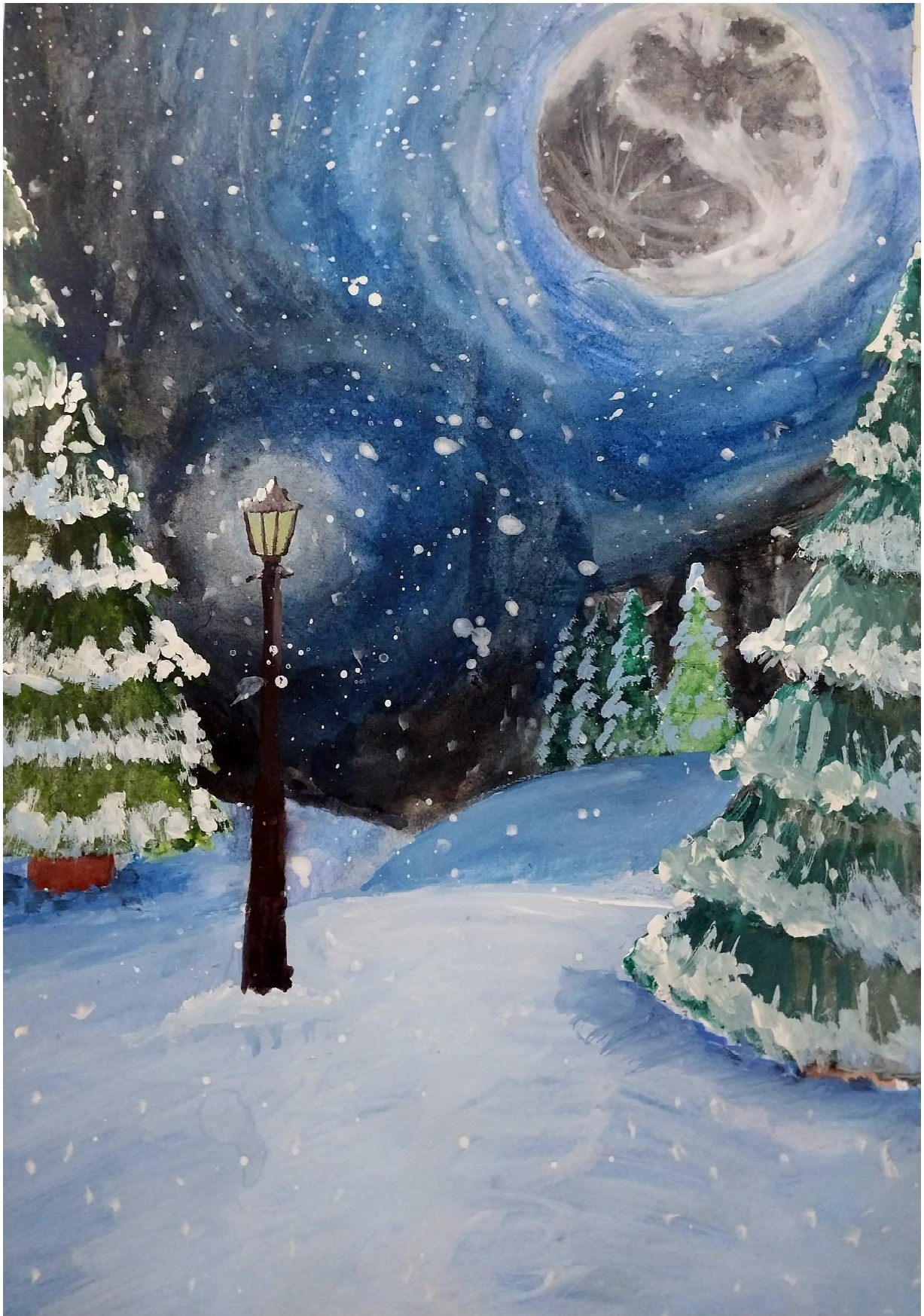
Автор рисунка “Ночь”: Пожарская Вера, 6 “Б”класс