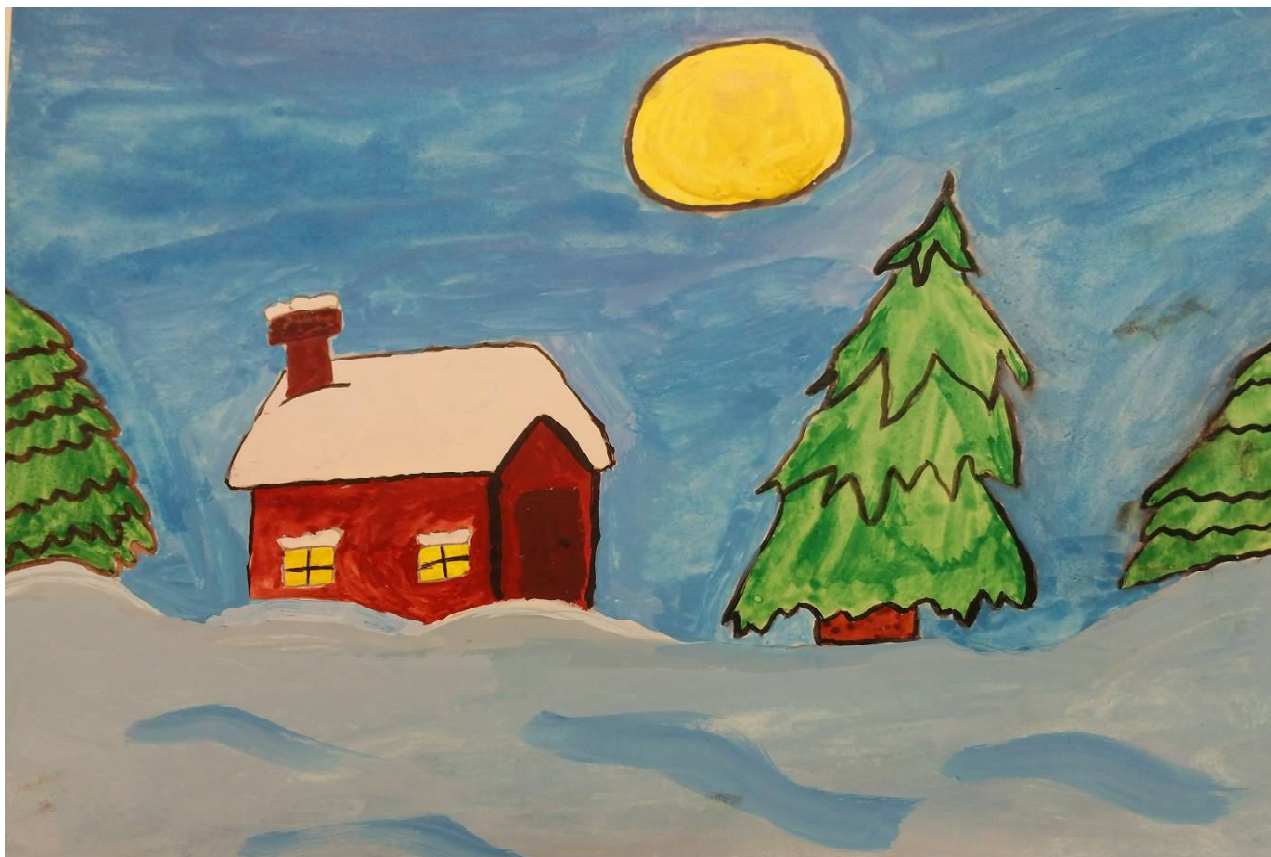
Автор рисунка «Зимний вечер»: Келембет Богдан 6 «В» класс