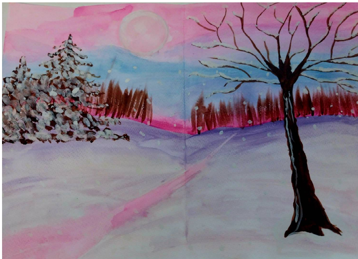
Автор рисунка "Розовый закат": Ульягина Варвара, 6 "А" класс