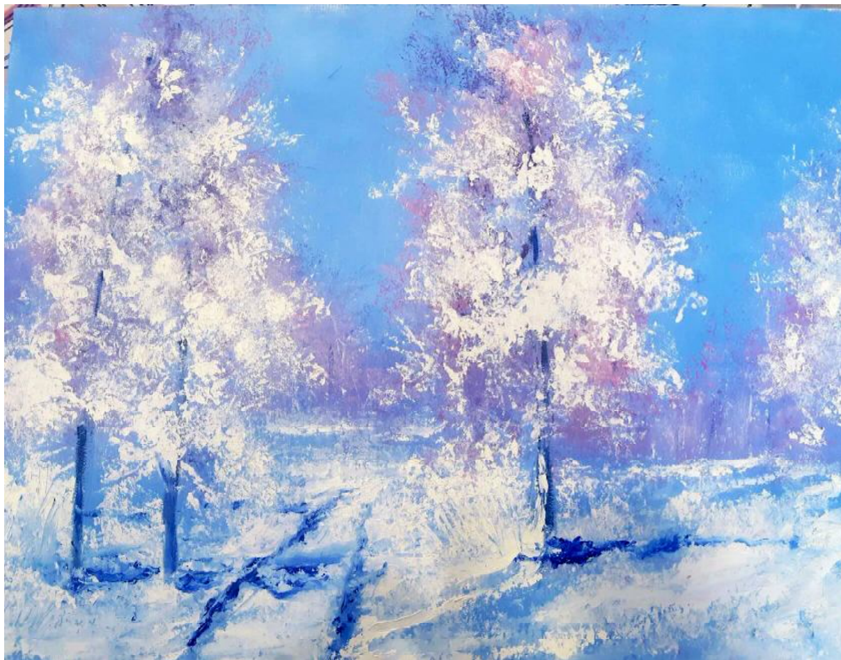
Автор рисунка “Зимнее утро”: Топоркова Лариса Николаевна, педагог-психолог, редактор журнала “Школьная пресса”

Все желающие могут приносить в редакцию фотографии своих творческих работ. Мы обязательно опубликуем ваши стихотворения, рассказы, рисунки, фотографии.