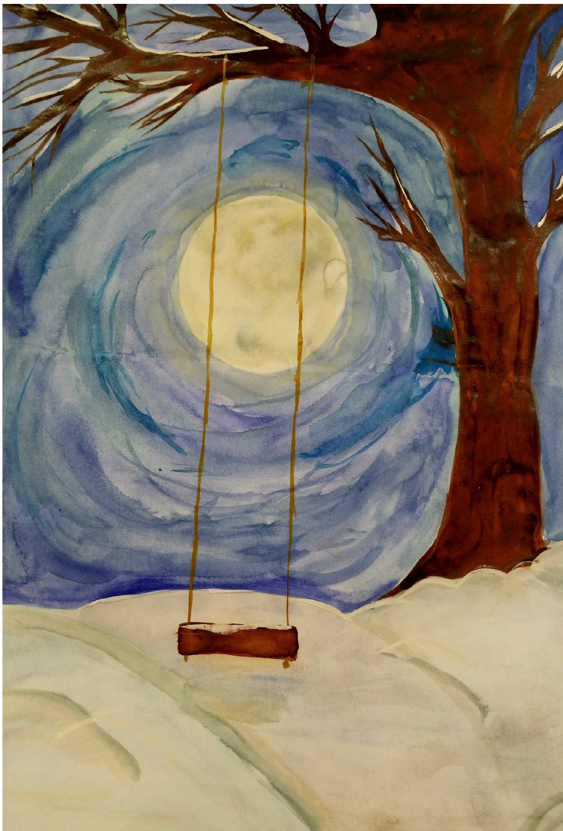
Автор рисунка «Качели»: Стефанцева Анастасия, 6 «Б» класс